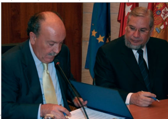
Momento de la firma del convenio de cooperación.