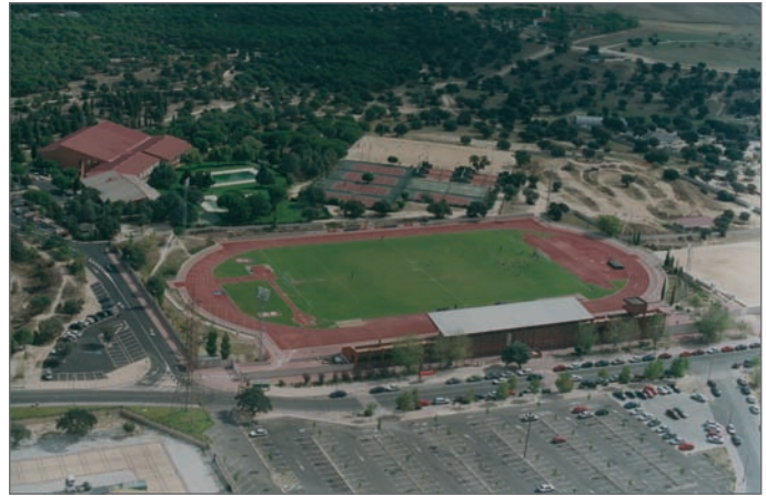
Arriba, una vista aérea del Complejo Polideportivo de Navalcarbón.

Estos trabajos se centran en convertir el actual campo de hierba natural a hierba artificial, incluyendo las obras necesarias para un perfecto funcionamiento, incluida la Red de Saneamiento, acondicionamiento del riego automático, megafonía e iluminación. Además, se están realizando trabajos para la sustitución del pavimento de la pista de atletismo, realizando las obras necesarias para reestablecer su perfecto estado, así como la reforma de las canaletas y la Red de Saneamiento de la misma.