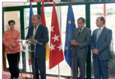
En la imagen superior, la nueva Escuela Infantil; y en la imagen inferior, Acto de Presentación