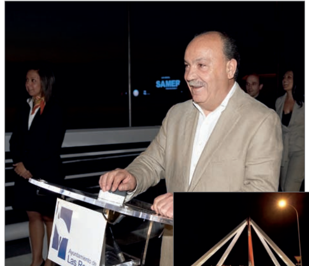
En la imagen superior, el momento del encendido del Puente

4.- También ha posibilitado la remodelación y mejora de la entrada a la vía de servicio, (pk 19,000, sentido Villalba) desacoplando el tráfico que circula por dicha vía de los movimientos de entrada y