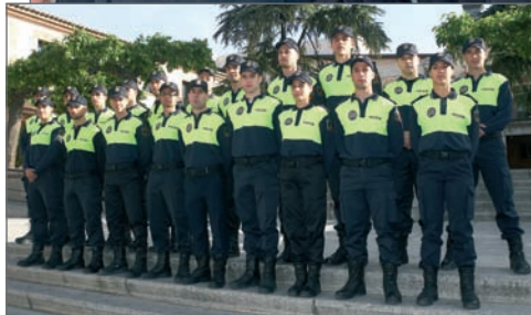
En la imagen superior, el Alcalde saluda a los nuevos Policías; a la izquierda, los nuevos efectivos al completo

El pasado 11 de mayo, se incorporaron los 21 nuevos policías procedentes del cupo asignado a este municipio con cargo a la Brigada Especial de Seguridad de la Comunidad de Madrid (BESCAM).