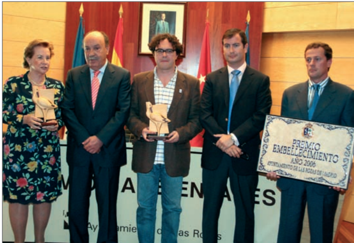
El Alcalde de Las Rozas junto a los premiados en esta Edición

El pasado 5 de junio, coincidiendo con el Día Mundial del Medio Ambiente, tuvo lugar la entrega de los Premios Medio Ambiente que el Ayuntamiento de Las Rozas convoca para reconocer a aquellas personas, colectivos e instituciones públicas y privadas de toda España que han destacado en la defensa y el desarrollo de los valores medioambientales. También se presentó el libro "El Clima de Las Rozas" elaborado por el Taller de Empleo "Desarrollo Sostenible" de la Concejalía de Economía, Empleo, Agentes Sociales e Innovación.